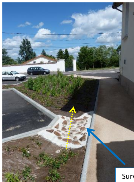
Surverse noue 1