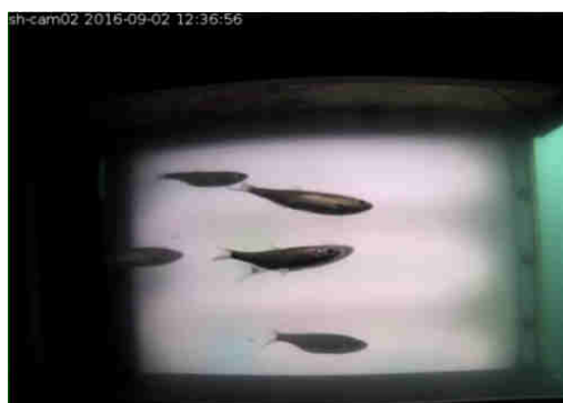
Figure 3 : Ablettes "capturées" lors de leur passage dans le boîtier

Enfin, les limites du système FISHLAB-GE résident actuellement dans les coûts d'exploitation (dépouillement manuel des vidéos) et les volumes d'informations numériques à faire transiter, à stocker et à archiver. Des pistes d'automatisation sont en cours.