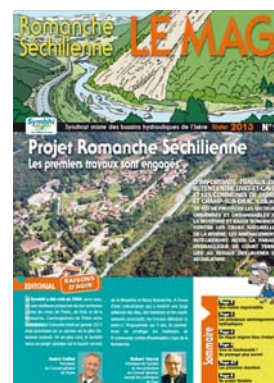
Magazine grand public « Romanche Séchilienne »