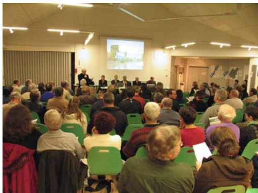
« Réunion publique Isère amont »