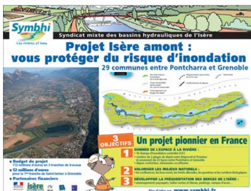
Panneau pédagogique « Isère amont »