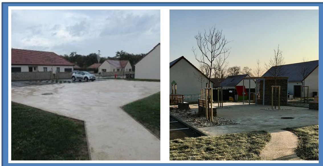
Avant-après l'aménagement de la place

La commune disposait de plusieurs aménagements dédiés à différentes générations d'habitants mais il manquait un espace pour les petits. Par ailleurs la place publique du lotissement est imperméable, non ombragée (îlot de chaleur). Elle n'offre aucun avantage, que ce soit en terme fonctionnel ou d'accueil de la biodiversité. Ainsi, le projet avait 2 ambitions fortes : offrir une aire de jeux aux plus jeunes et réellement réintroduire de la nature dans cet espace pour favoriser : l'infiltration, la recharge des nappes phréatiques, la réduction des îlots de chaleur, le développement de la biodiversité et notamment de la petite biodiversité urbaine.